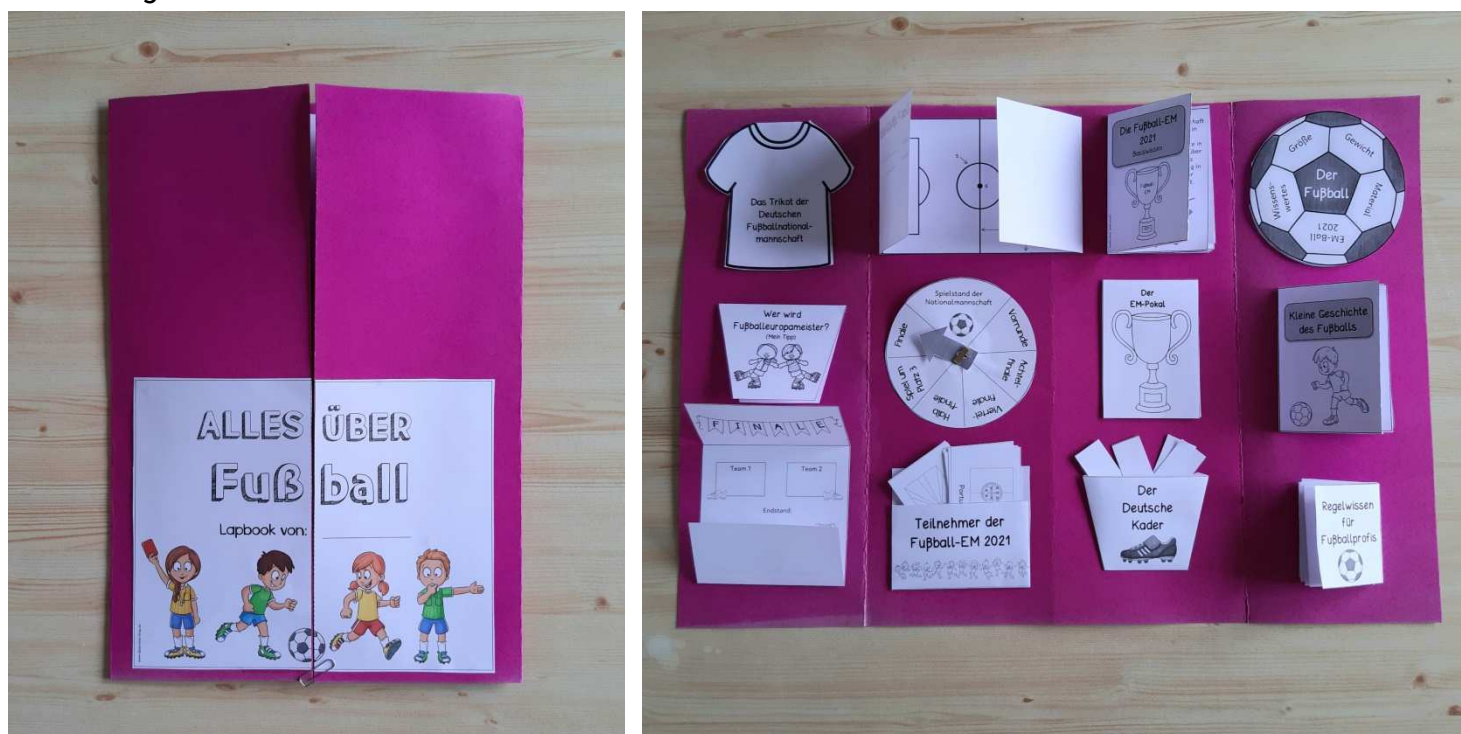
Außen- und Innenansicht des Lapbooks (Gestaltungsbeispiel aus dem Jahr 2021)

Das Deckblatt (mehrere Varianten zur Auswahl) sollte zuerst farbig gestaltet werden. Im Anschluss wird es an der Linie auseinandergeschnitten und an den beiden Außenklappen befestigt.